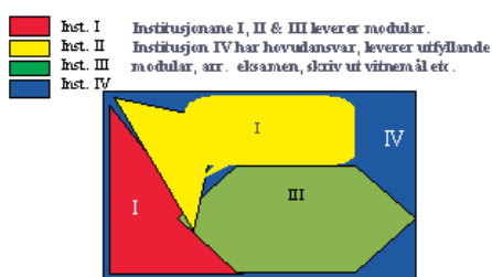
Fig. 2. Felles kursutvikling, t.d. PiOL.

Gjennomføringsgraden tok seg opp og PiOL har vist seg å vera liv laga. Det er vidareutvikla like fram til i dag. I fleire EU-prosjekt (MECPOL, DoODL, MENU)